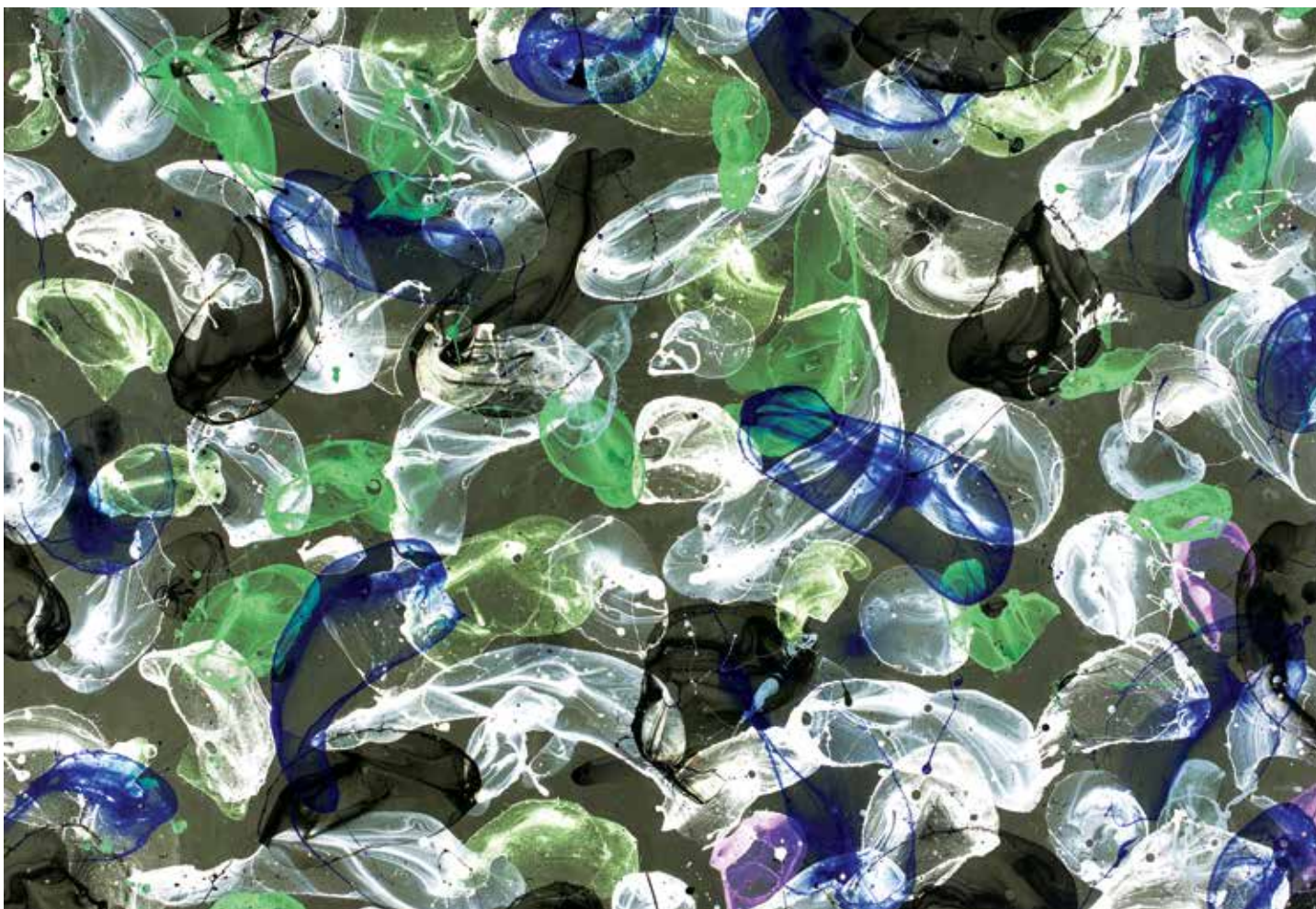
Za barvami, které Dokoupil používá pro svoje bubliny, se skrývá velká chemie. Používá pro ně umělé diamanty i jiné substance.

280 tisíc pokusů, co má být v žárovce, aby neprasklo vlákno a zůstala svítit. Žárovka už existovala dvacet let, ale fungovala tak pět minut, než vyhořela. Edisonovi z toho už bylo špatně, protože vyzkoušel všechno možné. Aby se uvolnili, šel s kamarády na ryby, měli na ně bambusové pruty a někdo z nich povídá: Hele, třeba je to řešení, tenhle podělanej bambus! Byl to vtip, ale když se vrátili, skutečně udělali vlákno z bambusu. A to vydrželo několik dní. A z toho vznikla revoluce!“