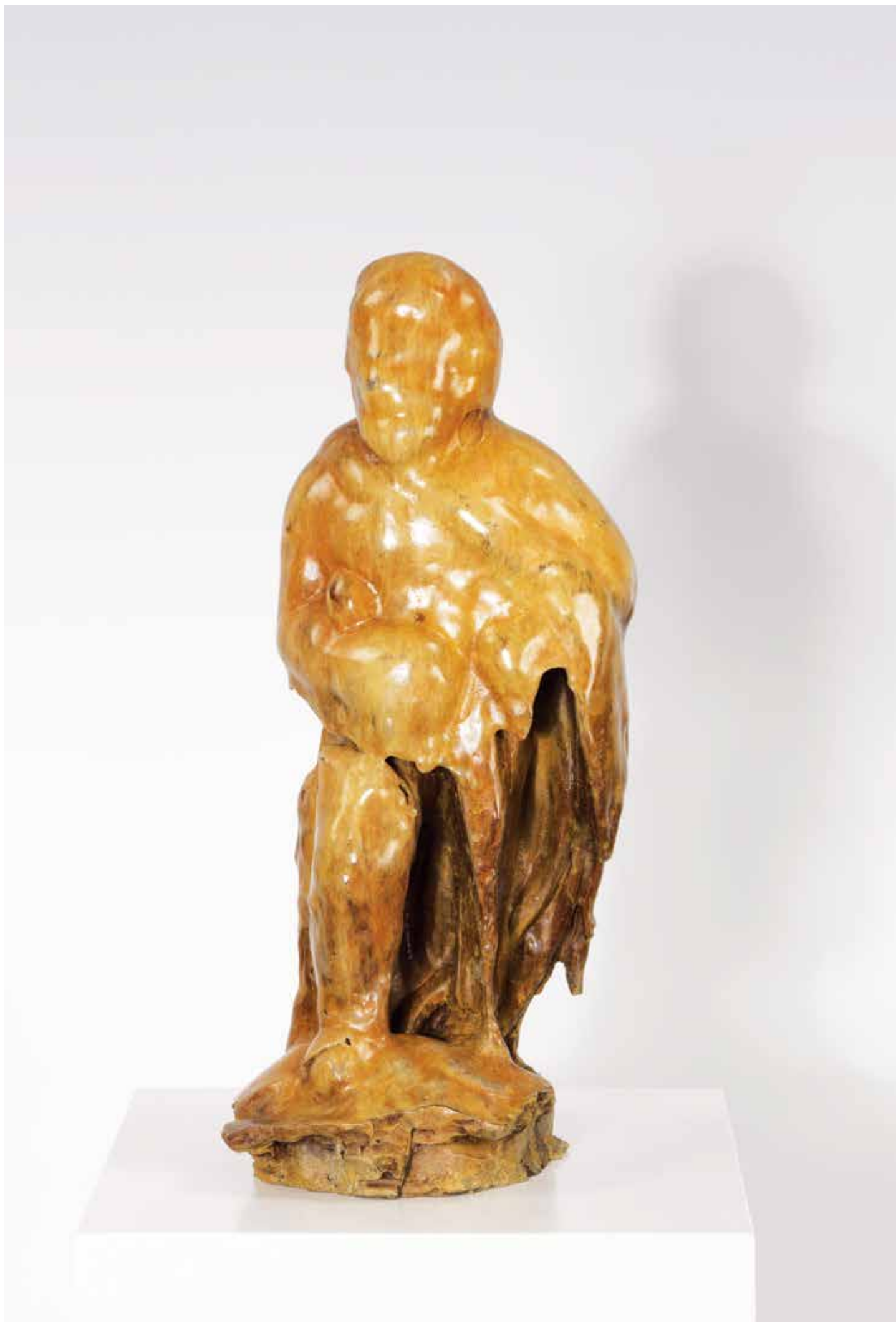
Jedna z nejnovějších Dokoupilových technik se jmenuje Gravity Sculptures.