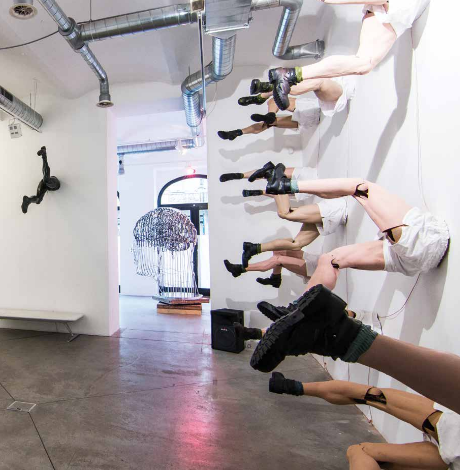
Pohled do expozice výstavy Black Hole. Letošní instalace Zátokovy nohy je celá v pohybu.

Manifesto od Juliana Rosefeldta. Nebyl to ten debilní videoart, kde je desetiminutový záběr na to, jak někdo škrabe v kýblu brambory. To je asi nějaká speciální masturbační technika jak kurátorů, tak umělců, tak lidí, kteří jsou ochotni jít na výstavu a koukat, jak se nic neděje, aby zjistili, že se opravdu nic neděje. Nerozumím tomu.