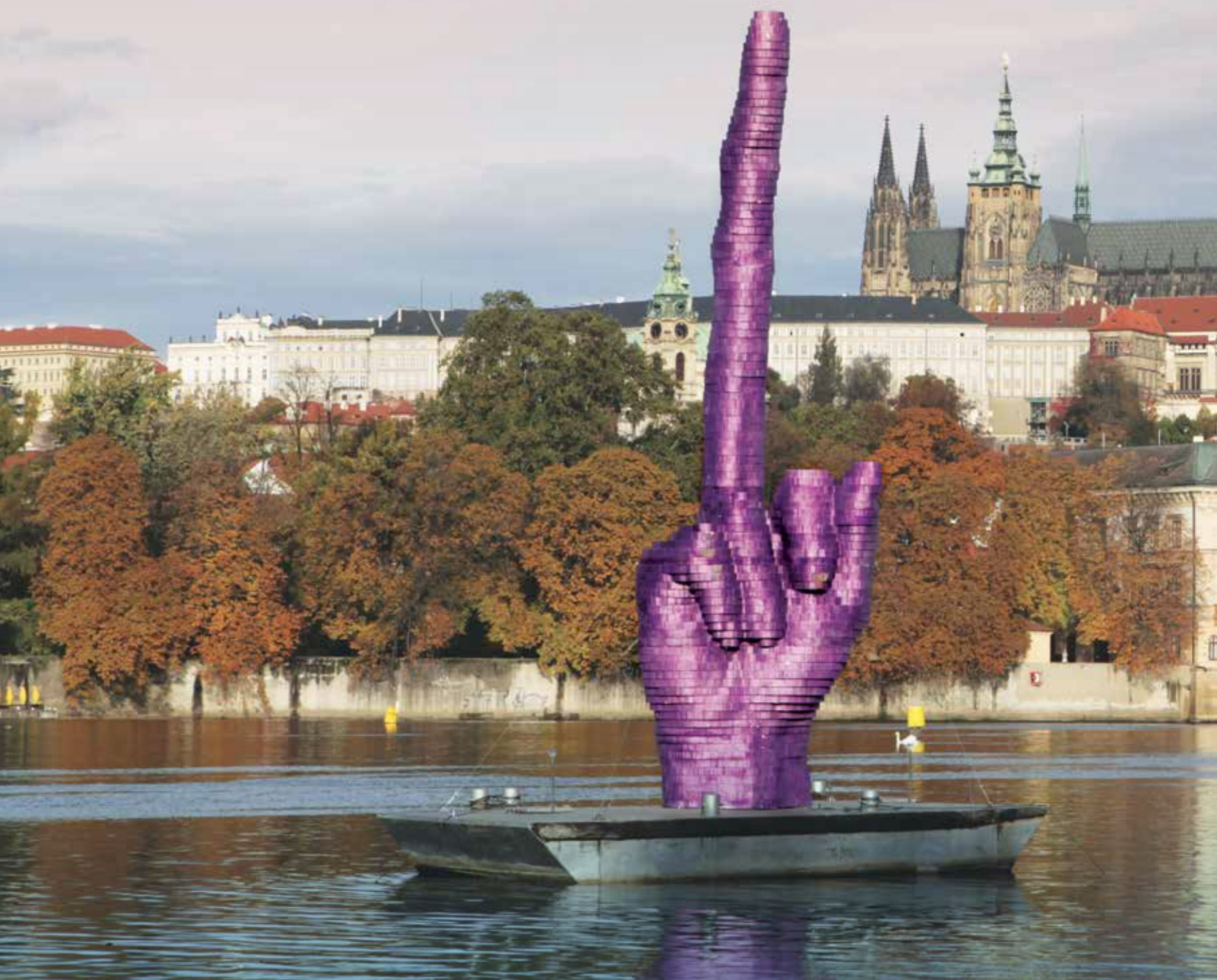
Desetimetrový Fakáč, který David Černý poslal Miloši Zemanovi, vzbudil v roce 2013 mezinárodní rozruch. V den vystavení se zpráva o něm stala nejklikanější na serveru New York Times.

velikosti a purpurové nepřehlédnutelnosti vztyčil na Vltavě směrem k pražskému Hradu jako vzkaz Miloši Zemanovi a „těm zmrdům komunistickéj zrasanej“. Ale v mnoha ohledech tenhle v plovoucím uměleckém objektu zachycený „fuck off postoj“ dobře vystihuje jeho vztah k části současné art scény i novinářům i zbytečné snaze vysvětlovat díla. „S médií pracuji velmi aktivně,“ zasměje se trochu cynicky na vysvětlenou, proč v současnosti odmítá devadesát devět procent veškerých rozhovorů, přestože když se s ním potkáte jen tak na pivu, může to skončit několikahodinovou debatou. Stačí natuknout špatné téma a je jasné, proč.